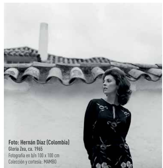
Foto: Hernán Díaz (Colombia) Gloria Zea, ca. 1965 Fotografía en b/h 100 x 100 cm Colección y cortesía: MAMBO

El legado de Gloria Zea se mantendrá vivo en la memoria de los colombianos, gracias a su aporte invaluable al arte y a la cultura del país